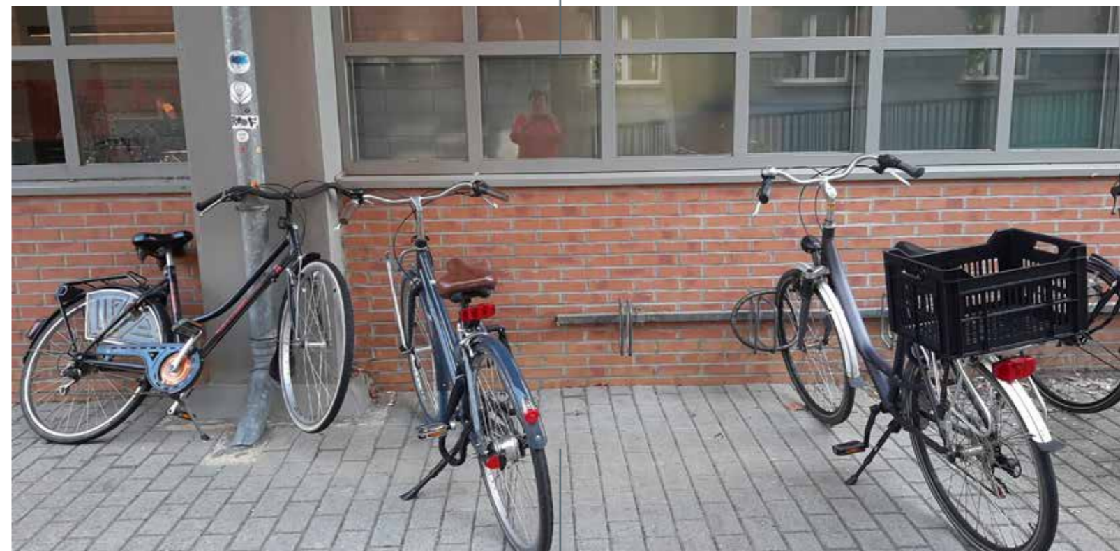
● AVENUE CERAMIQUE 250, MAASTRICHT