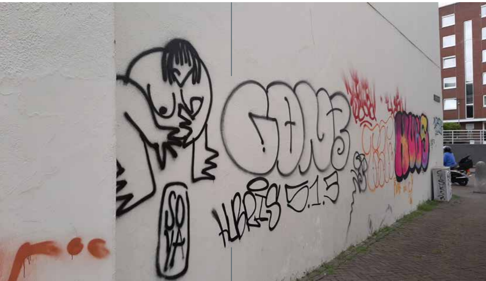
● HOGE BARAKKEN, MAASTRICHT