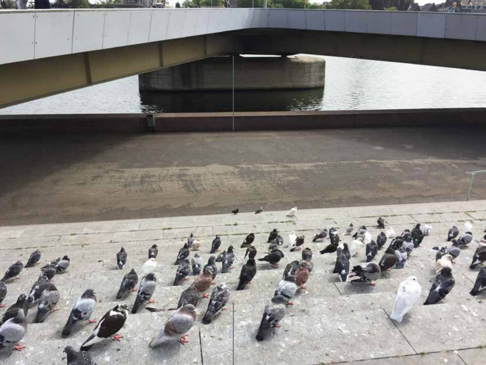
● MAASBOULEVARD, MAASTRICHT