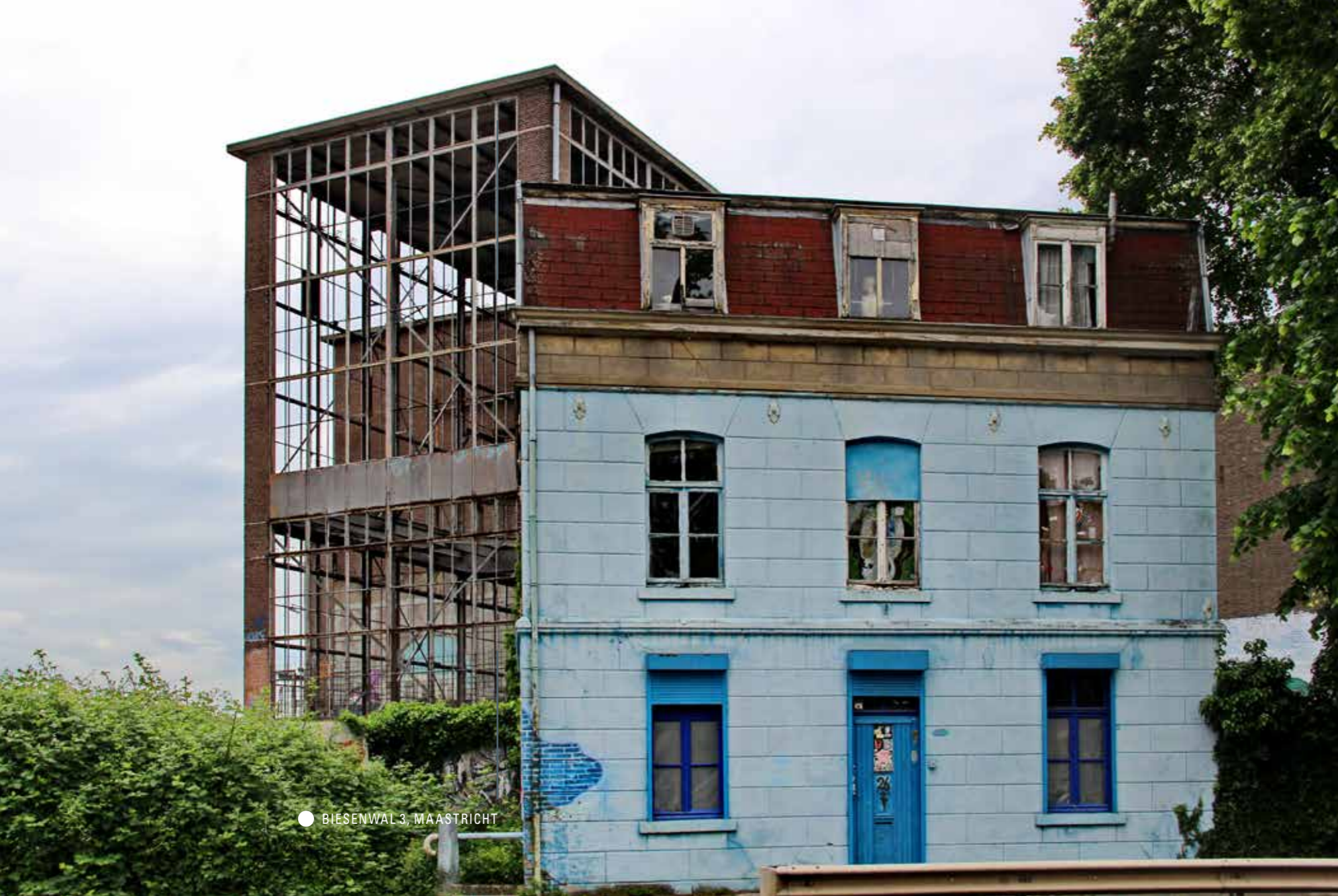
● BIESENWAL 3, MAASTRICHT