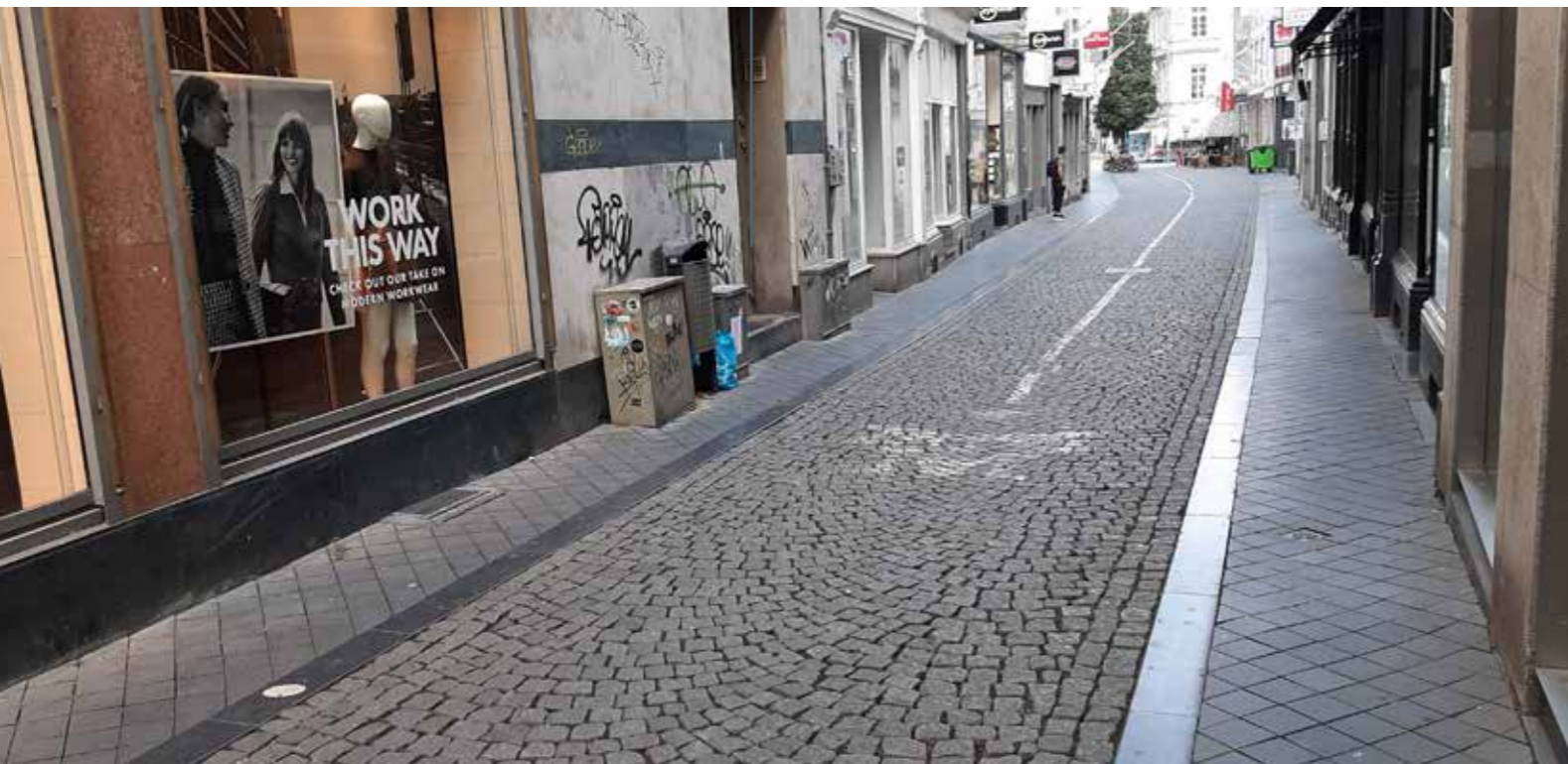
● GROTE STAAT - NIEUWSTRAAT, MAASTRICHT