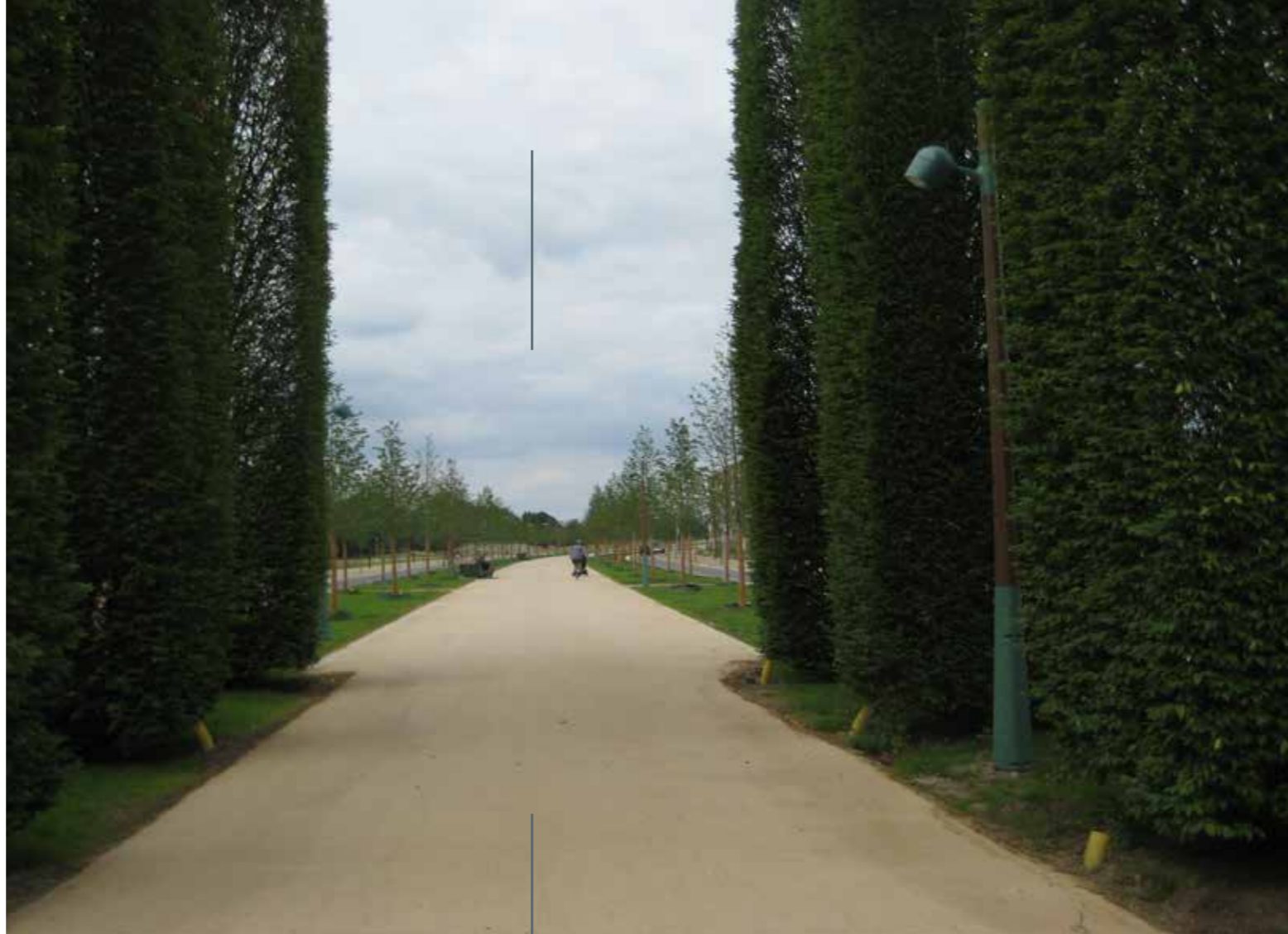
● DE GROENE LOPER, MAASTRICHT

Hoe kansrijk dit gebied wordt geroemd door de Gemeente, en soms zelfs idyllisch beschreven in Via Maastricht , de werkelijkheid is inmiddels heel anders. Ontegengesteld is de gecreëerde ruimte mooi en divers, maar er zitten ook keerzijden aan. We moeten constateren dat de wegen als onderdeel van De Groene Loper steeds meer worden gebruikt als een racebaan (waar fietsers niet langer welkom zijn) en bovendien neemt de verkeersintensiteit enorm toe. Een gevolg is dat het promeneren, flaneren, keuvelen, joggen en fietsen tussen de bomen helemaal niet meer zo vanzelfsprekend is. Er is oplettendheid geboden, zeker